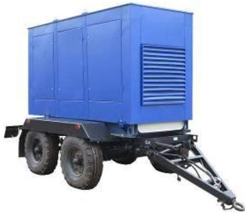
Дизель генератор в погодозащитном капоте на шасси