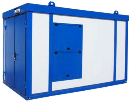
Дизельная электростанция в блок контейнере «Север»

Дизель-генераторные установки в зависимости от условий эксплуатации могут быть выполнены в следующих исполнениях: